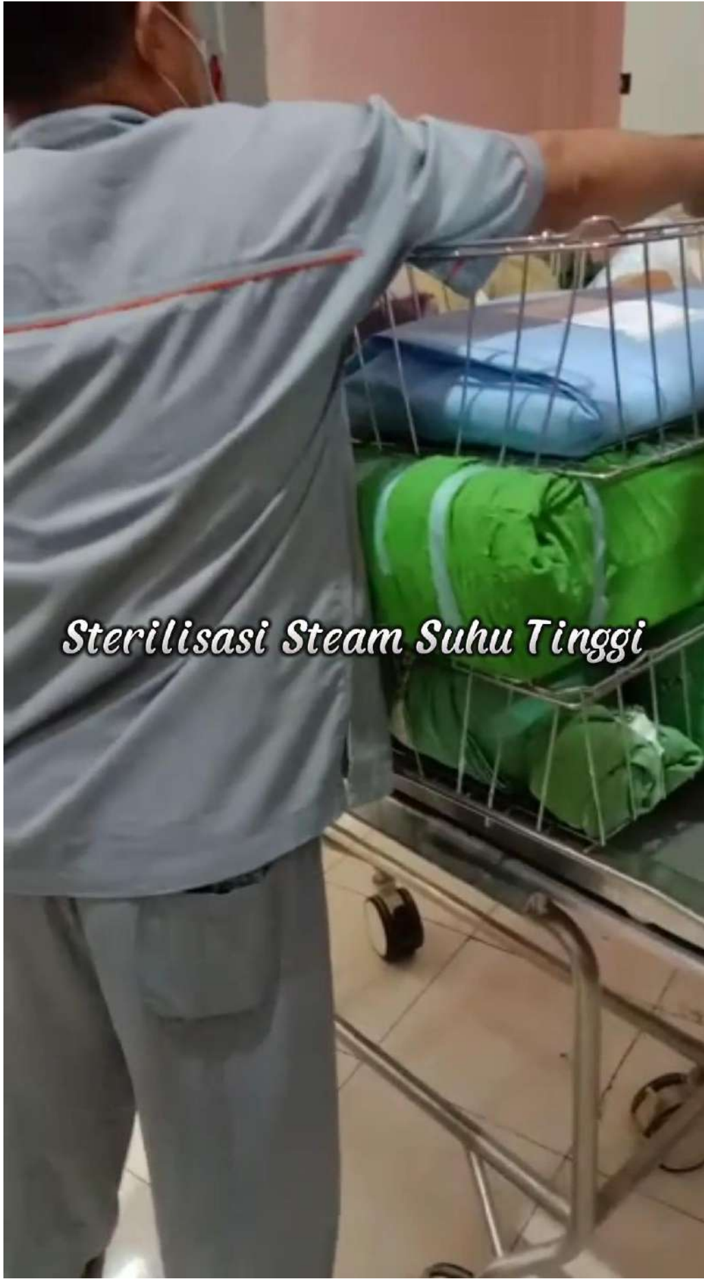
Sterilisasi Steam Suhu Tinggi