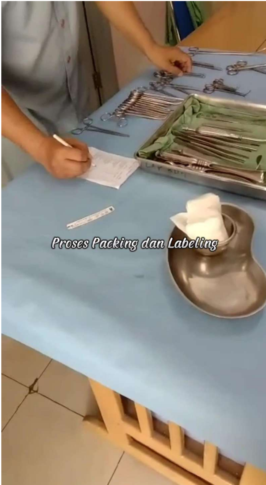
Proses Packing dan Labeling